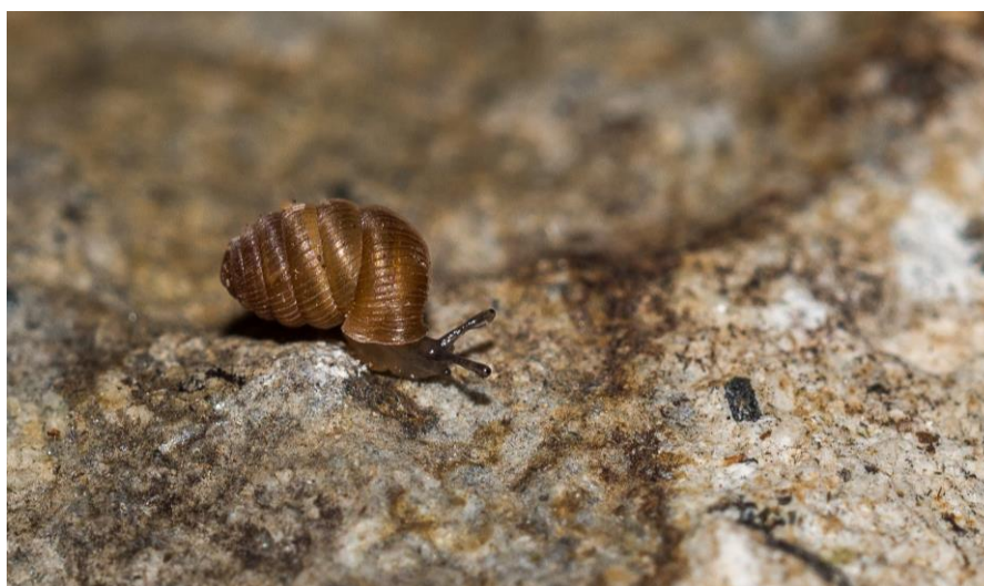
Fig. 2. Pagodulina pagodula pagodula (Des Moulins, 1830). Hauteur de la coquille : 3,30 mm. Diamètre : 1,95 mm.